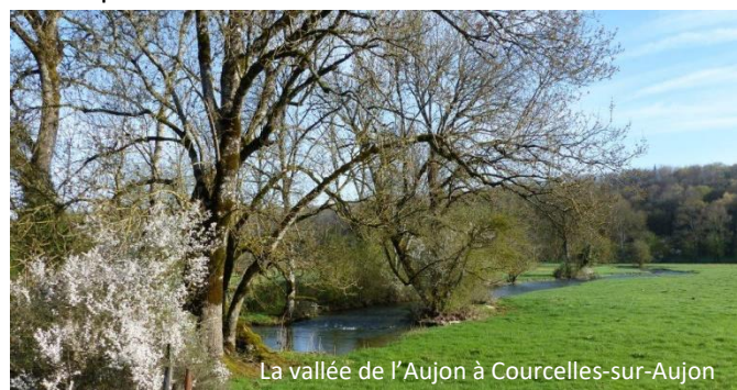
La vallée de l'Aujon à Courcelles-sur-Aujon

La haute vallée de l'Aujon représente un vaste ensemble de milieux aquatiques et de milieux prairiaux riches en faune et en flore. Cette vallée alluviale à l'accent montagnard, relativement étroite, est dominée par les herbages. Au-delà de ses richesses écologiques, elle présente un intérêt paysager remarquable.